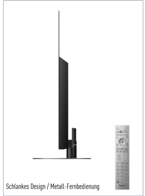
Schlankes Design / Metall-Fernbedienung

Neue Möglichkeiten des Fernsehens – Unterstützung von TV>IP, zahlreicher Apps und des HbbTV Operator App Standards